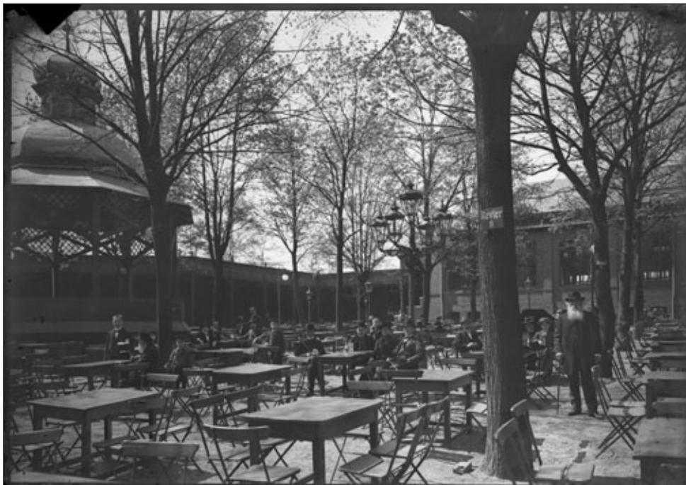
Titelblatt des Kalenders: Gartenrestauration der Görlitzer Aktienbrauerei (Landskron) um 1900