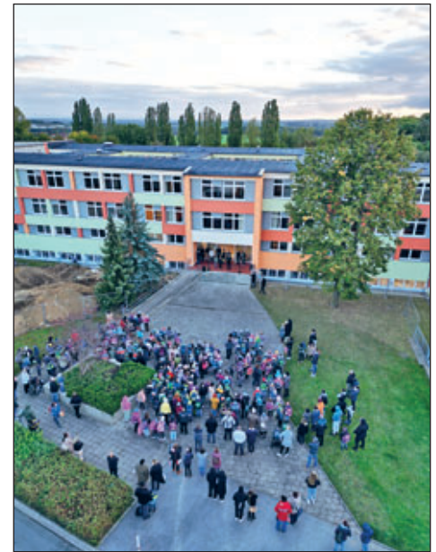
Luftaufnahme vom Schulkomplex beim ersten Schultag nach den Herbstferien

Die Bauabschnitte sind noch nicht schlussgerechnet, sodass die tatsächlichen Gesamtbaukosten noch nicht vorliegen. 1. und 2. BA „Brandschutzertüchtigung“ ca. 1,8 Mio. EUR, davon ca. 1,2 Mio. EUR Fördermittel 3. und 4. BA „Weiterführende Sanierung“ ca. 6,0 Mio. EUR, davon ca. 3,2 Mio. EUR Fördermittel.