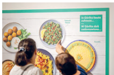
Ausstellungsimpression Prost Mahlzeit

Es ist angerichtet: In abwechslungsreichen Führungen, kulturgeschichtlichen Spaziergängen, Exkursionen, Podiumsdiskussion und Stammtischen bieten Ihnen die Görlitzer Sammlungen über die Laufzeit der aktuellen Sonderausstellung »Prost Mahlzeit!« im Görlitzer Kaisertrutz ein facettenreiches Programm rund um Speisesitten und Traditionen, Ernährungsgewohnheiten, Lebensmittelproduktion gestern und heute und zum Gegenwarts- und Zukunftsthema Nachhaltigkeit. Ganz sicher: Auch in den