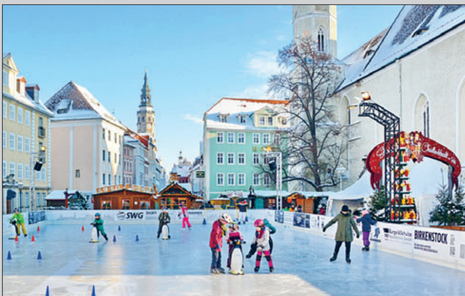
Eislaufen in Görlitz

Täglich geöffnet von 10:00 bis 20:00 Uhr, Freitag und Samstag bis 21:00 Uhr Die genauen Laufzeiten inklusive der Eisenerneuerungszeiten können dem ausliegenden Flyer entnommen werden.