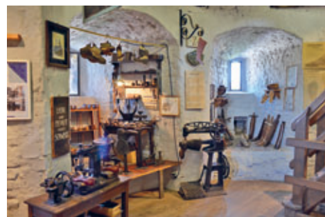
Nikolaiturm, Ausstellungsimpression zur Geschichte des Handwerks

Im Nikolaiturm zeigt eine Dauerausstellung die Geschichte des Handwerks und der Infrastrukturen in Görlitz. Sie präsentiert Objekte, die seit 1955 durch den »Zirkel der Görlitzer Heimatforscher« zusammengetragen wurden. In den einzelnen Turmgeschossen sind sowohl historische Straßenlaternen und hölzerne Wasserleitungen aus Görlitz zu sehen als auch Werkzeuge und Materialien verschiedener Handwerksberufe. Den Abschluss bildet die sich über beide Obergeschosse des Turms erstreckende, mit historischen Ausstattungsstücken eingerichtete Türmerwohnung.