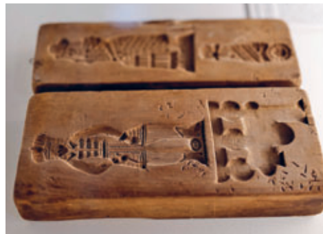
Pfefferkuchenmodell von 1854

Für Führungen außerhalb der Öffnungszeiten entstehen Zusatzkosten für verlängerten Service.